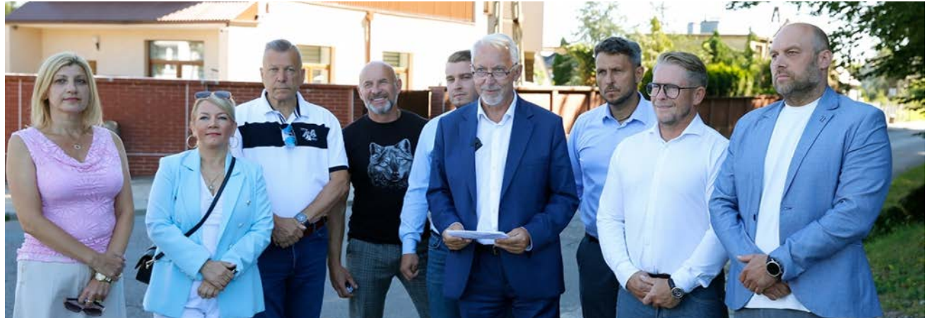
fol. UM Wejherowo

lę, Bartłomieja Freya; modernizacja ul. Kociewskiej, modernizacja ul. Bema, modernizacja ul. Gdańskiej – 3 nitka, ul. Chmielewskiego do drogi wojewódzkiej, przebudowa ul. Szczukowskiej, przebudowa ul. Brzechwy, przebudowa ul. Bolduana, przebudowa ul. Obrońców Poczty Gdańskiej –