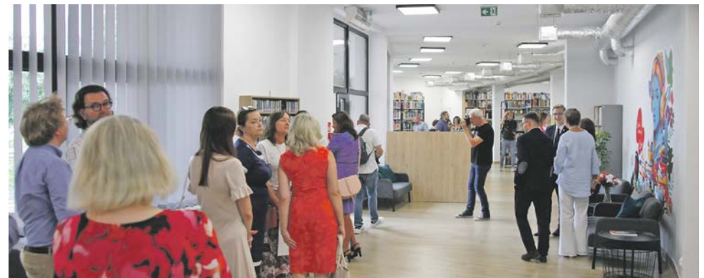
fol. Biblioteka Słupsk