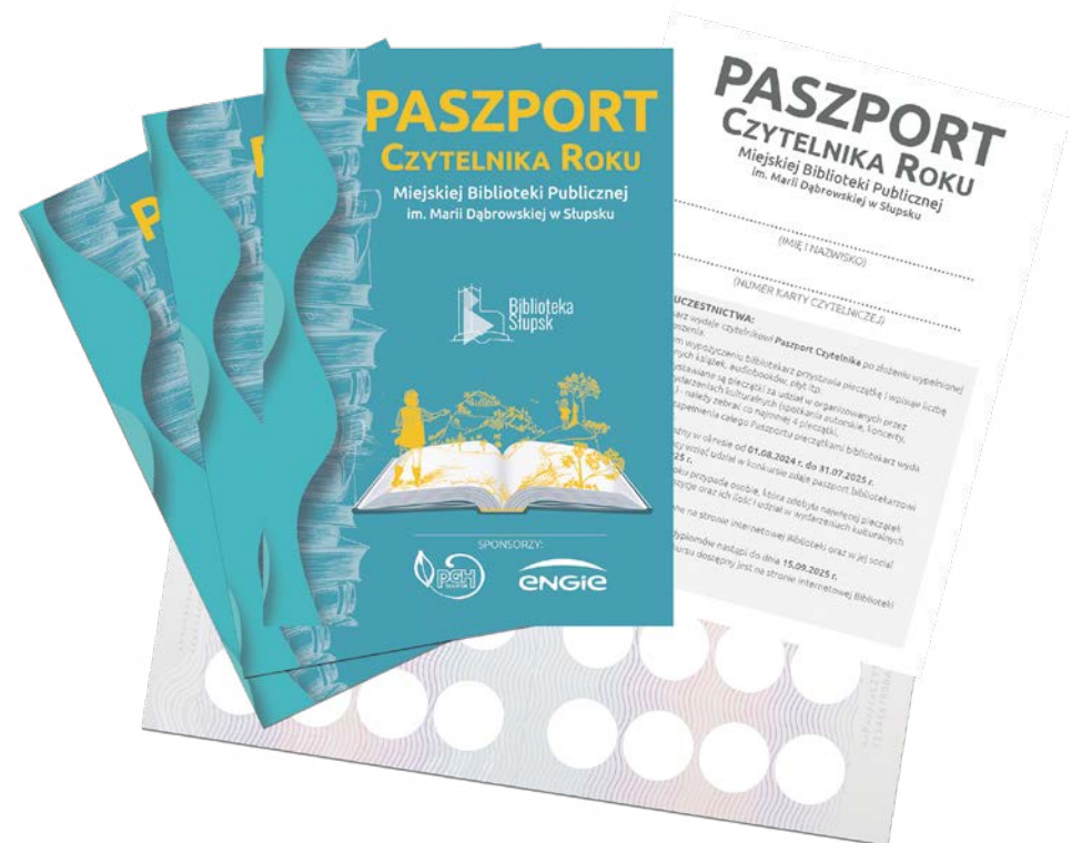
fol. CIT w Słupsku

czas do 31.08.2025r. na zdanie Paszportów do Biblioteki. Uroczyste wręczenie dyplomów (i tradycyjnie drobnych upominków) podczas uroczystej gali nastąpi do dnia 15 września 2025r. Jedynym wymogiem aby wziąć udział w konkursie jest posiadanie ważnej karty bibliotecznej oraz wypełnienie Karty Zgłoszenia. Nie ma ograniczeń wiekowych, podobnie jak w latach ubiegłych dyplomy przyznawane będą w następujących kategoriach wiekowych: do lat 6, 7-11 lat, 2-16lat, 17-24 lata, 25-45 lat, 46-79 lat oraz powyżej 80 lat. Regulamin konkursu dostępny jest na stronie internetowej Biblioteki oraz na miejscu w Bibliotece i jej filiach. Dodatkowe informacje można też uży-