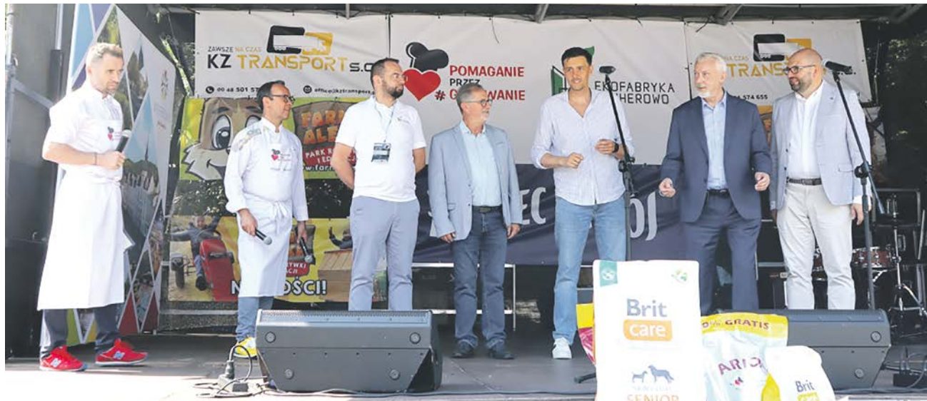
fol. UM Wejherowo

Zabawa połączona z edukacją – to najlepszy sposób, aby zachęcić mieszkańców do zmiany postawy na bardziej ekologiczną, zaczynając już od najmłodszych. Uczestnicy Pikniku Ekologicznego połączonego z akcją „Pomaganie przez gotowanie” – mogli degustować kuchni z różnych stron świata za datkę w formie cegiełki