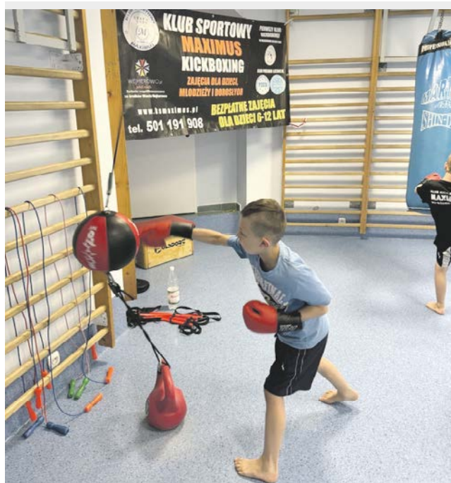
fol. UM Wejherowo

Zajęcia są bezpłatne dla dzieci z Wejherowa. Szkolenie i zajęcia sportowo-rekreacyjne dzieci i młodzieży dofinansowane jest z budżetu Miasta Wejherowa w ramach dotacji udzielanych organizacjom pozarządowym. Zajęcia ogólnorozwojowe z technikami kickboxingu, judo i samoobrony dla dzieci od 6 do lat 12 będą odbywały się w poniedziałki w godz. 18.00-19.00 i środy 17.00-18.00. Zajęcia młodzieży i dorosłych - grupa początkująca i zawodnicza - zaplanowane są na poniedziałki i środy