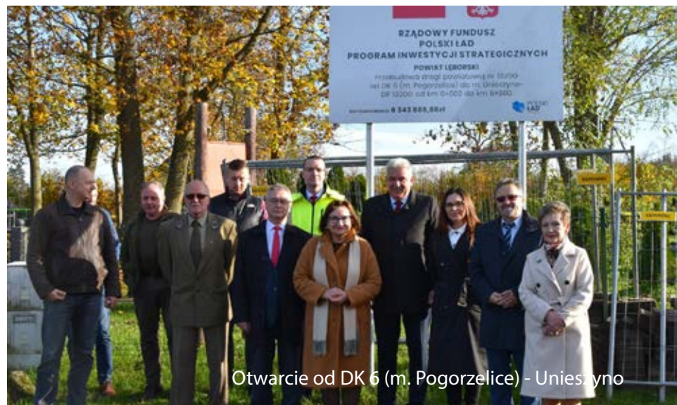
Otwarcie od DK 6 (m. Pogorzelice) - Unieszyno

Chociaż nowy rok dopiero się rozpoczął, to w planach znajduje się realizacja kolejnych 7 przedsięwzięć o łącznej wartości prawie 15 mln zł z dofinansowaniem zewnętrznym aż w 71 proc. wartości, co potwierdza skuteczność w umiejętności pozyskiwania środków zewnętrznych na najważniej-