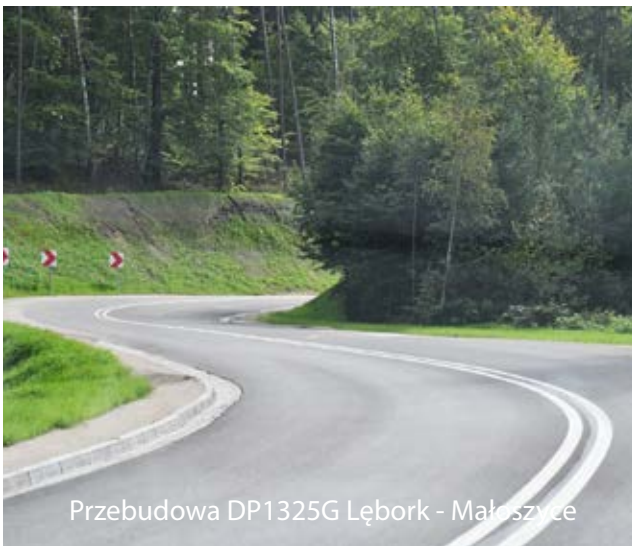
Przebudowa DP1325G Łęborg - Małszyce