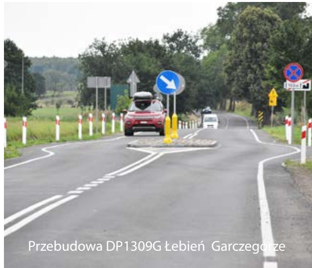
Przebudowa DP1309G Łebień Garczegorze