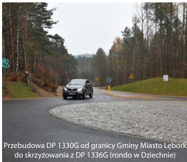
Przebudowa DP 1330G od granicy Gminy Miasto Łęborg do skrzyżowania z DP 1336G (rondo w Dziechnie)