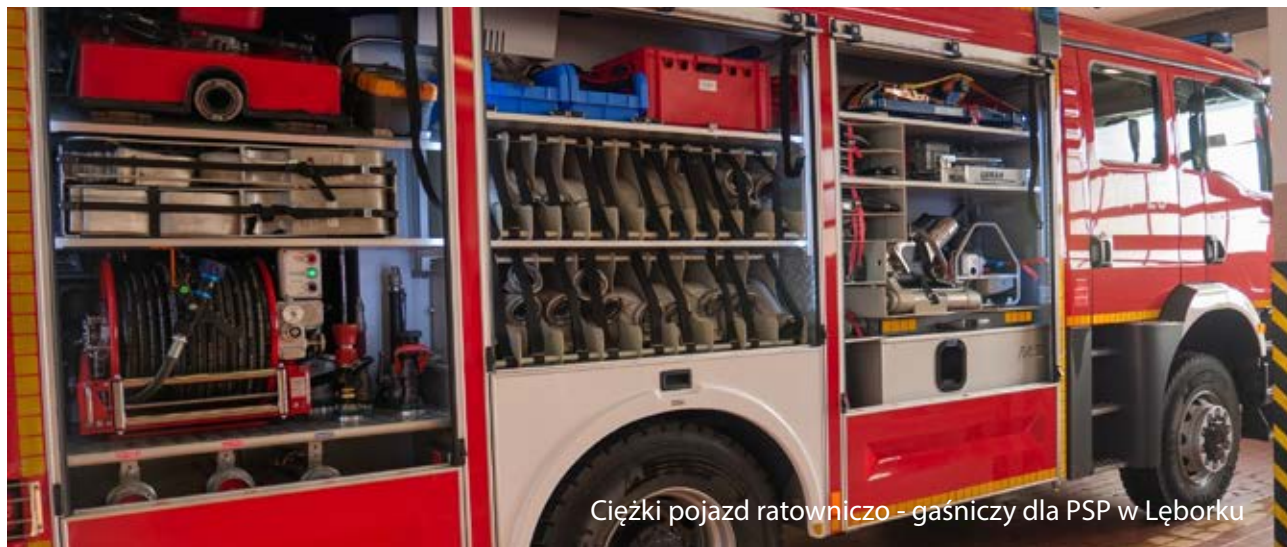
Ciężki pojazd ratowniczo - gaśniczy dla PSP w Łęborku