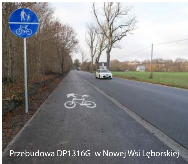
Przebudowa DP1316G w Nowej Wsi Łęborskiej