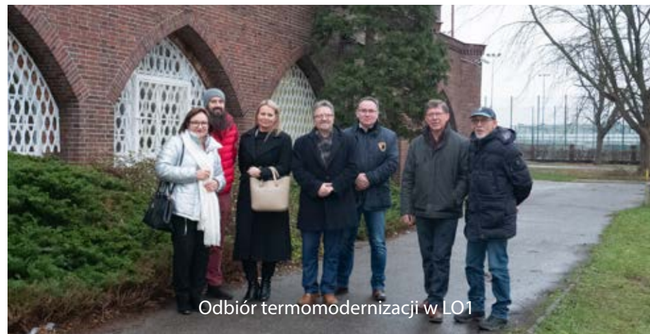
Odbiór termomodernizacji w LO1

dla miasta budynku. Nieco wcześniej Powiat sfinansował wymianę pokrycia dachowego na Zespole Szkół Ogólnokształcących nr 2, co zakończyło proces wymiany dachu na całości kompleksu budynków zajmowanych przez Zespół Szkół Mechaniczno-Informatycznych i ZSO 2, przywracając historyczny wygląd bryły budynków i poprawiając odporność na warunki atmosferyczne.