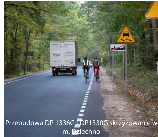
Przebudowa DP 1336G i DP1330G skrzyżowanie w m. Dziechno