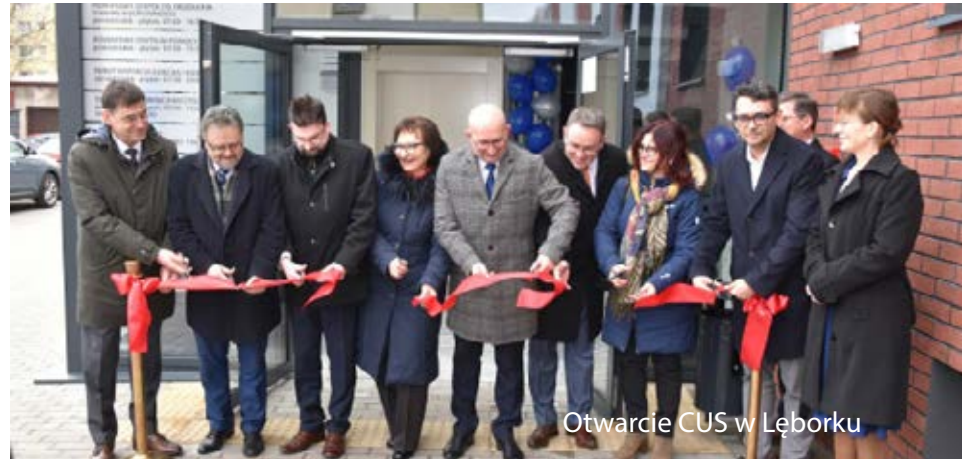
Otwarcie CUS w Łęborku

wo wyposażone budynki, które powstały w rekordowo krótkim czasie 18 miesięcy zapewniają miejsca dla 28 podopiecznych. Warto ponad 3,5 mln zł inwestycja została wykonana w technologiach energooszczędnych i wspierających redukcję emisji CO2. Zupełnie nowe spojrzenie na zagadnienie szeroko pojmowanej pomocy społecznej realizowane jest przez działające od niespełna roku Centrum Usług Społecznych. Wchodzące w skład CUS jednostki świadczą pomoc w sposób kompleksowy, obejmując wsparcie w szerokim spektrum problemów w jednym miejscu. W Centrum działają: Powiatowe Centrum Pomocy Rodzinie, Powiatowy Zespół ds. Orzekania Niepełnosprawności, Poradnia Psychologiczno-Pedagogiczna, Punkt Wsparcia Dziecka i Rodziny dla Dzieci z Pieczy Zastępczej i ich Rodzin, Ośrodek Interwencji Kryzysowej - Hostel dla Matek /