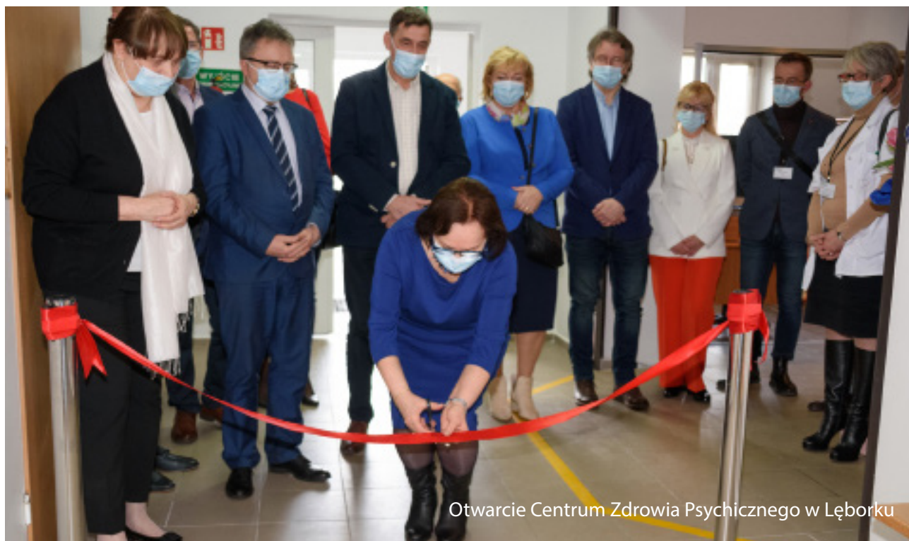
Otwarcie Centrum Zdrowia Psychicznego w Łęborku

Ogromnym sukcesem w zakresie opieki zdrowotnej jest uruchomienie w lutym ub. r. Centrum Zdrowia Psychicznego w ramach programu pilotażowego reformy Narodowego Programu Ochrony Zdrowia Psychicznego (NPO-ZP). Łęborskie CZP działa na terenie powiatu łęborskiego oraz gmin Choczewo, Łęczy-