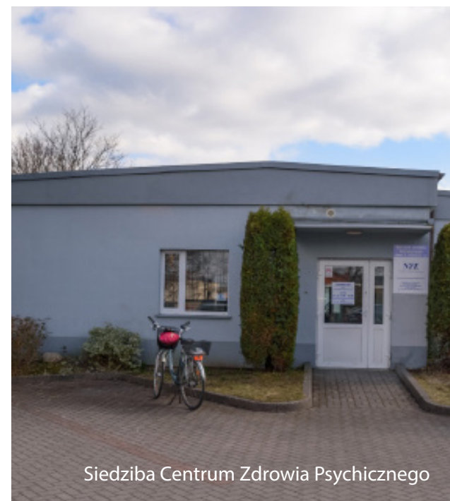
Siedziba Centrum Zdrowia Psychicznego

organizacyjny zakłada jako nadrzędny cel przywrócenie osoby chorej psychicznie lub doznającej kryzysu psychicznego do aktywnego funkcjonowania społecznego w różnicowanych rolach: w środowisku rodzinnym, zawodowym, towarzyskim oraz w aktywnościach związanych ze spędzaniem wolnego czasu. Podjęcie kontaktu z pracownikami Centrum Zdrowia Psychicznego odbywa się bez skierowania oraz bez zapisywania na wizytę – można wejść po pomoc prosto „z ulicy”. Powstanie takiej placówki jest niezwykle cenne w czasach, kiedy problemy psychologiczno-psychiatryczne zyskują rangę niemal choroby cywilizacyjnej.