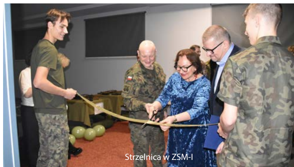
Strzelnica w ZSM-I

Powiat Łęborski wygrał konkurs MON na wsparcie budowy wirtualnej strzelnicy przy Zespole Szkół Mechaniczno - Informatycznych. Nieco wcześniej, na terenach przy Powiatowym Centrum Edukacyjnym powstało nowoczesne boisko z siłownią „pod chmurką”. W obu powiatowych liceach ogólnokształcących wykonano prace poprawiające warunki