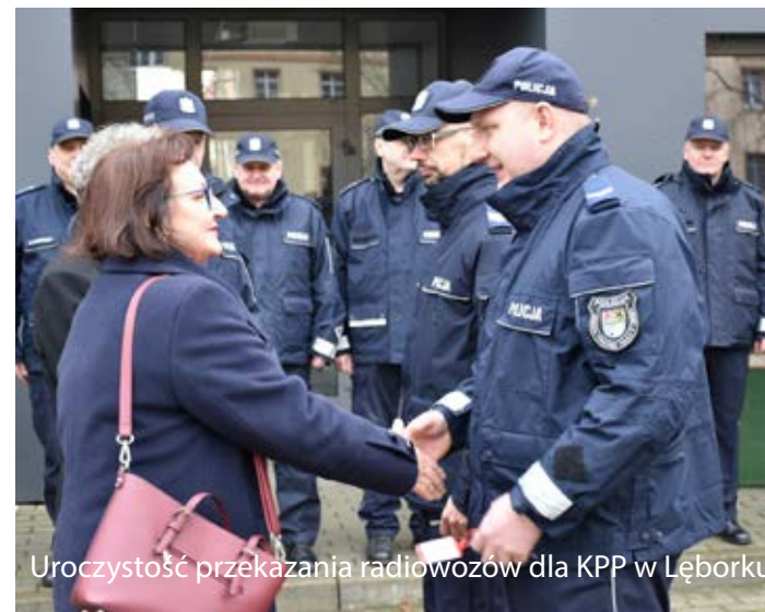
Uroczystość przekazania radiowozów dla KPP w Łęborku

Wcześniej Powiat wsparł zakup radiowozów dla Komendy Powiatowej Policji. Zakup został sfinansowany po połowie przez samorządy powiatu i miasta oraz środki pochodzące z Komendy Wojewódzkiej Policji. W 2023 r. Zarząd Powiatu przeznaczył 50 tys. zł na wsparcie zakupu kolejnego oznakowanego radiowozu dla KPP w Łęborku.