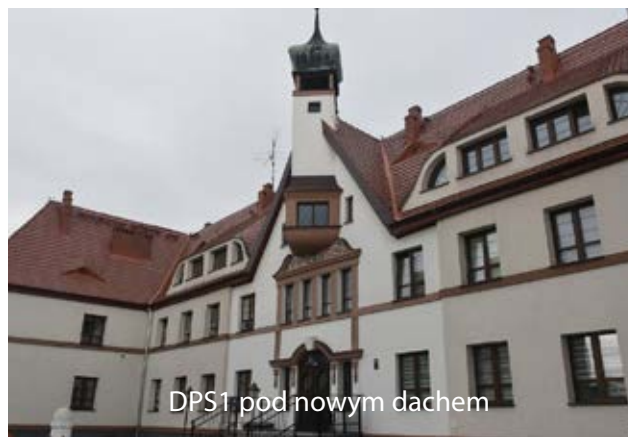
DPS1 pod nowym dachem