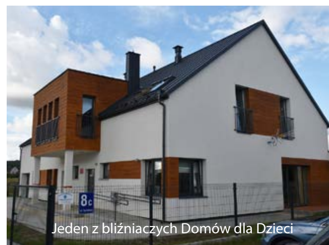
Jeden z bliźniaczych Domów dla Dzieci

Ojców z Dziećmi i Kobiet w Cięży, Klub Seniora, Stowarzyszenie EDUQ. Realizacja projektu CUS stała się możliwa dzięki środkom z Europejskiego Funduszu Społecznego, zarządzanego przez Urząd Marszałkowski, środkom rządowym w ramach Rządowego Funduszu Inwestycji Lokalnych oraz w wymiarze prawie 3,5 mln zł ze środków własnych Powiatu Łęborskiego.