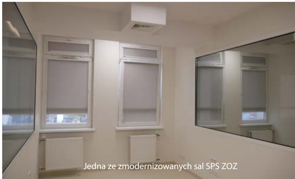
Jedna ze zmodernizowanych sal SPS ZOZ