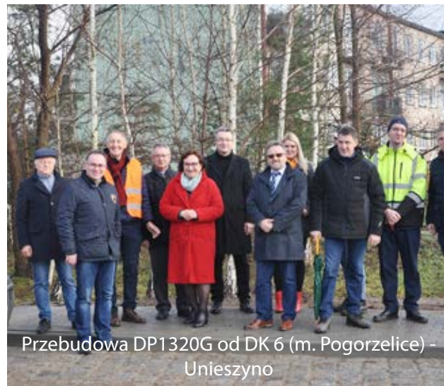
Przebudowa DP1320G od DK 6 (m. Pogorzelice) - Unieszyno