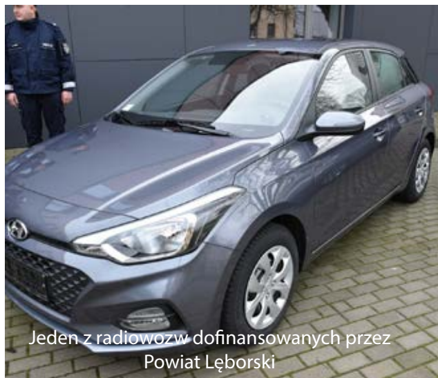
Jeden z radiowozów dofinansowanych przez Powiat Łęborski