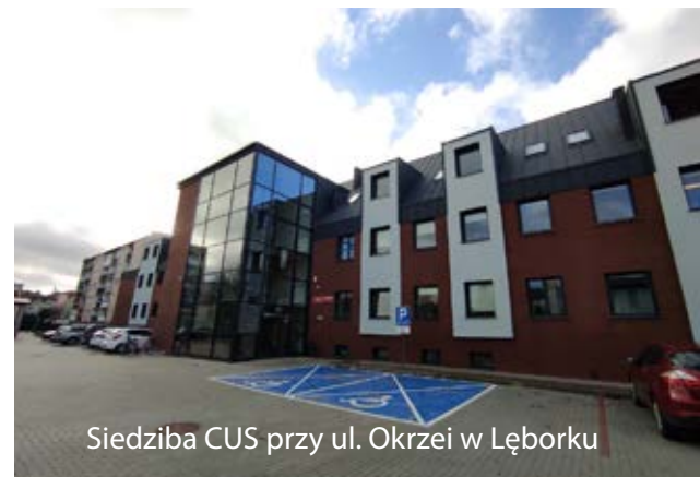
Siedziba CUS przy ul. Okrzei w Łęborku