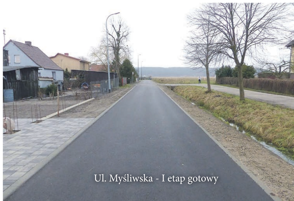
Ul. Myśliwska - I etap gotowy

Przy ulicy Kanałowej na odcinku długości 250 m - od ronda im. Lecha Bądkowskiego do ul. Pomorskiej - w połowie grudnia ub.r. rozpoczęła się budowa chodnika. Chodnik, szeroki na 180 cm jest już gotowy. Ma poprawić bezpieczeństwo pieszych, którzy do tej pory musieli poruszać się jezdnią lub ziemno-trawiastym poboczem. W planach jest II etap budowy chodnika, na odcinku od Pomorskiej do Lubelskiej.