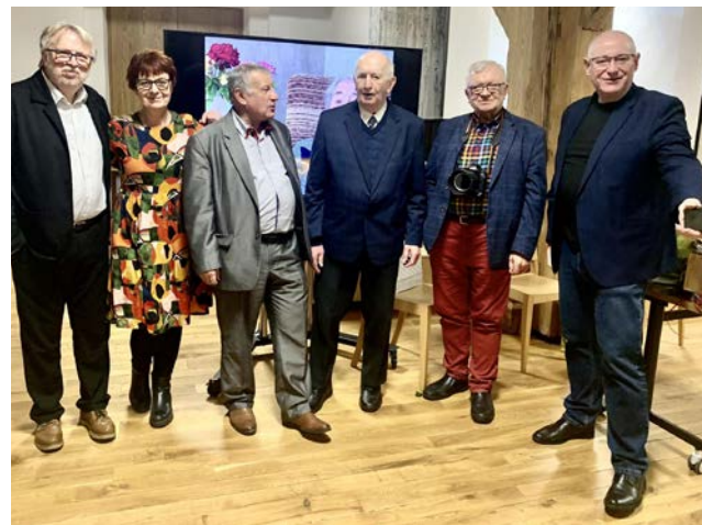
fol. D. Sroka