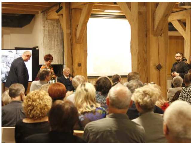
fol. MBP Słupsk