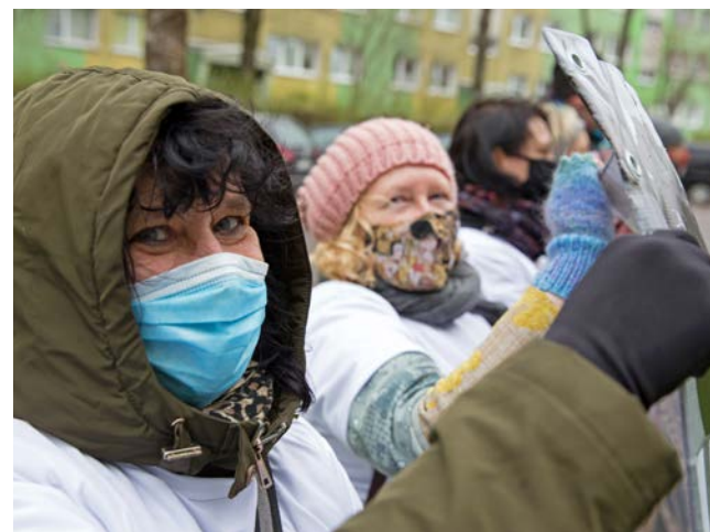
fol. S. Żabicki